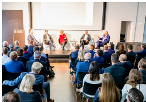
^ Podiumsdiskussion bei der FNG-Siegel-Verleihung