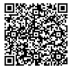
Roundtable Nachhaltigkeit Seite 40