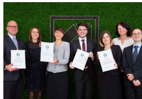
^ Kathrein Privatbank präsentiert ihre Auszeichnungen