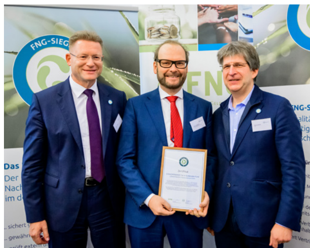
^ CONVERTINVEST Entgegennahme der Auszeichnung