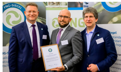
Shareholder Value Management AG Entgegennahme der Auszeichnung

Bank für Sozial- wirtschaft Entgegen- nahme der Auszeichnung